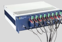
bis zu 5 MPV-808 Erweiterungsmodule