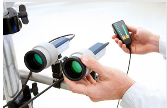
MPV-A-830 Signalpegelanzeige, für bequemes Fokussieren