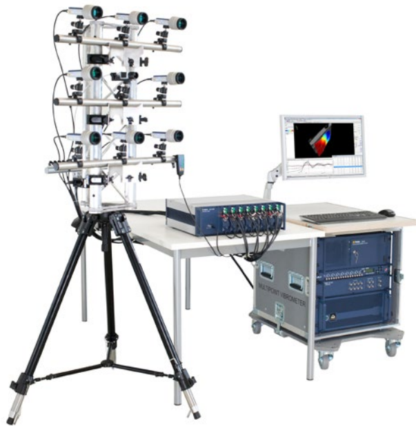
MPV-800 Basis-System mit 8 optischen Kanälen

Das MPV-800 ist als modulares System für den Einsatz im Entwicklungslabor oder im Prüffeld konzipiert. Die große Zubehörpalette ermöglicht die Anpassung des Messsystems an die jeweilige Versuchsanordnung und erleichtert Aufbewahrung und Handhabung.