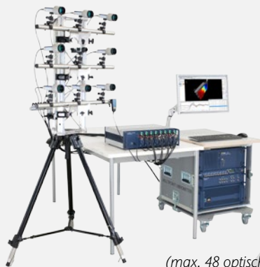
(max. 48 optische Kanäle insgesamt)