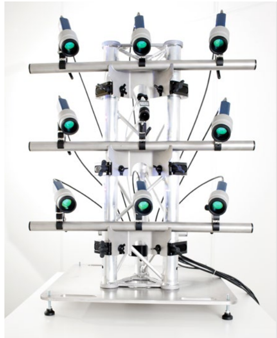
MPV-A-T20 Stativ auf MPV-A-T20-B Basisplatte für Messung in Bodennähe