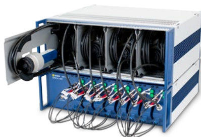
MPV-A-860 Faserkopfablage für MPV-O-810 Faserköpfe